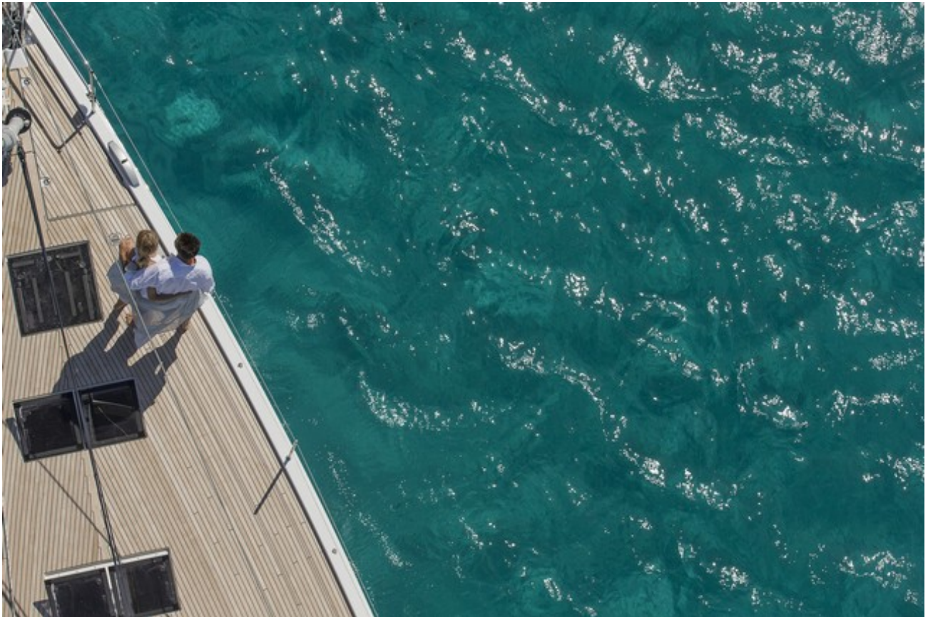
(c) Jeanneau 64 – Chantier Jeanneau

Aunque el salón de METS en Ámsterdam es la mejor referencia en los certámenes de equipamiento, cada vez más los salones de otoño se adelantan con numerosas primicias de no pocos fabricantes. Esta es una selección de artículos que estarán disponibles en los nuevos catálogos. A. BREL